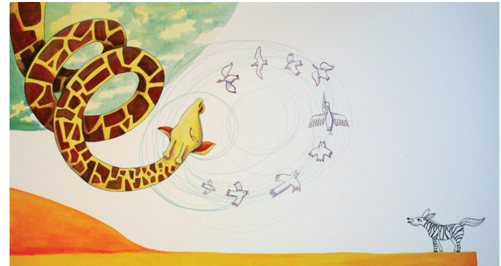
Zgodba o zamorčku Bambuleju in vrtoglavi žirafi, avtor Frane Milčinski - Ježek, Založba Sanje, 2010