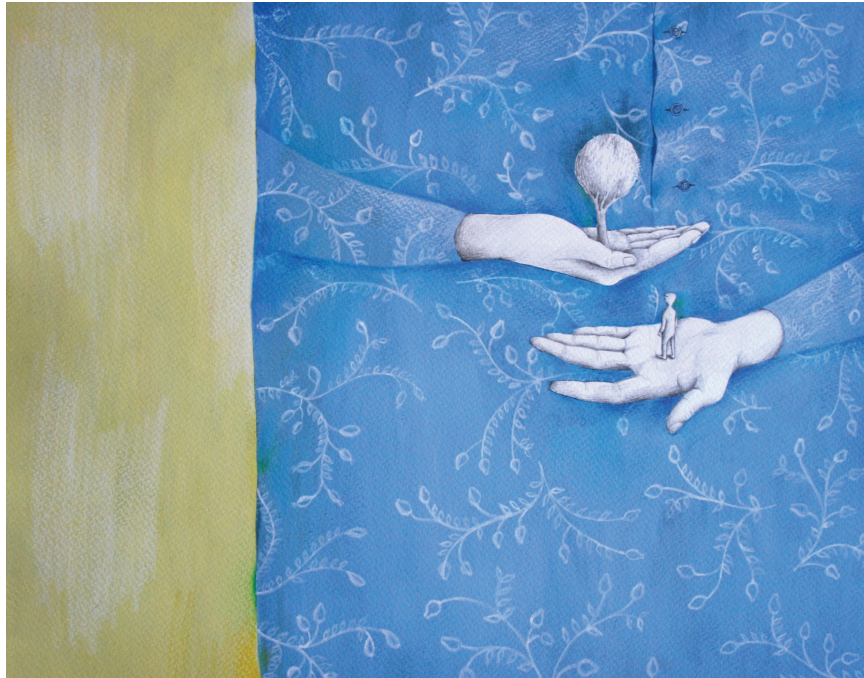
Samogovori, avtorica Majda Mencinger, ZAK in Sophia, 2013